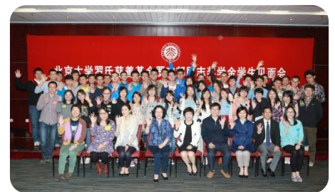
■ 羅氏學生與香港義工大合照。