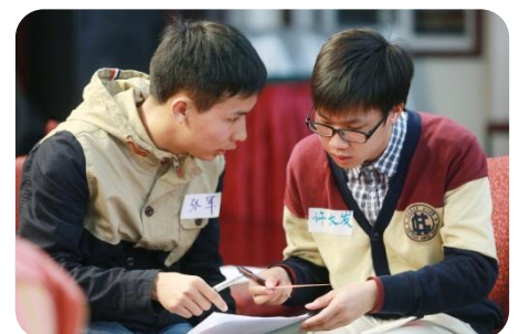
■ 同學們互相交換聯繫，成為彼此在學業及成長路上的小伙伴。