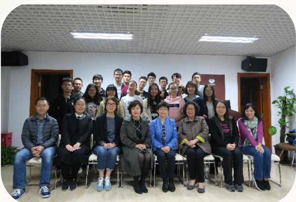
「學生互助平台」換屆典禮