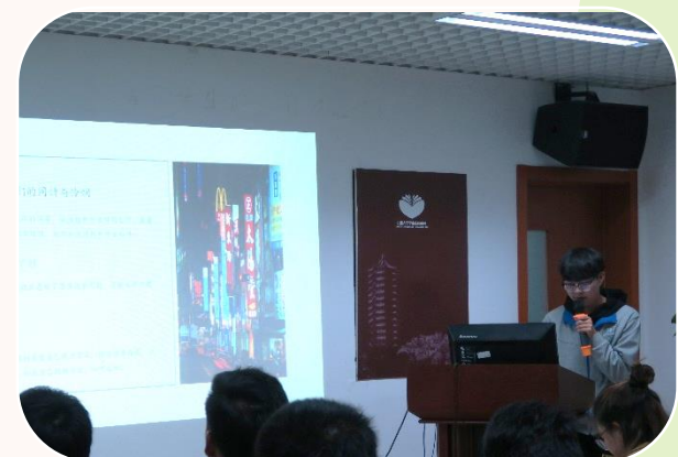
夢想飛翔計劃分享會