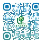
羅氏慈善基金 網頁

請瀏覽羅氏慈善基金網頁( www.lawscharitable.org.hk )。