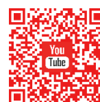
羅氏慈善基金 YouTube 頻道