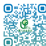
羅氏慈善基金 網頁