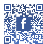
羅氏慈善基金 FACEBOOK 專頁