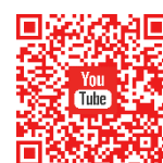
羅氏慈善基金 YouTube 頻道